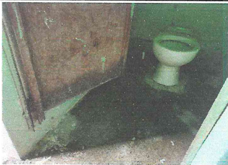
Foto 11: Los baños necesitan ser cambiados los inodoros, repintar, cambiar puertas y sistemas de agua y hay sectores del centro educativo donde se necesita cambiar la torta del suelo.