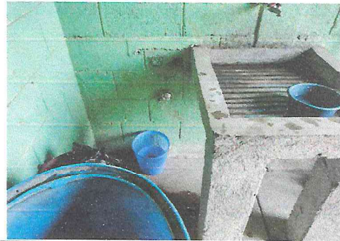
Foto 2: Solo existe un lavadero con un tonel al lado que funciona como lavamanos y pila, por lo tanto necesita ser cambiado por lavamanos y pila adecuados para su uso.