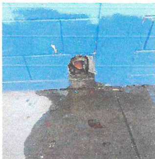
Foto 5: Se necesita mejorar drenajes e instalaciones pluviales para que se distribuya correctamente el agua.