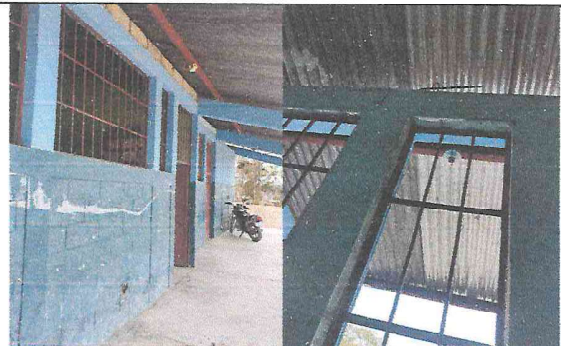
Foto 10: La parte superior de las aulas necesita ser sellada correctamente con block y cemento, se necesitan plafoneras.