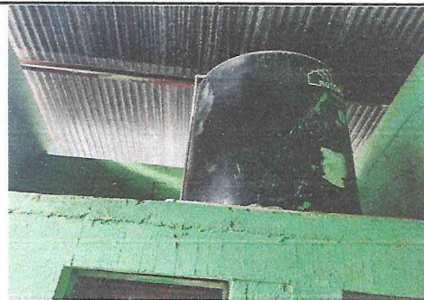
Foto 6: Se necesita un rotoplast de mayor capacidad debido a la cantidad de estudiantes y al escaso servicio de agua potable.

Observación: Si es necesario se pueden agregar hojas adicionales y actualizar el número de hojas.