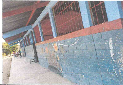
Foto 8: Todas las paredes del centro educativo necesitan ser pintadas.