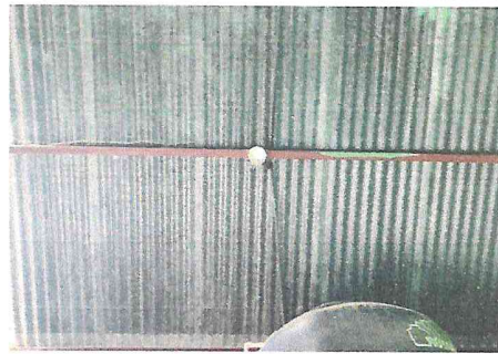
Foto 4: En los sanitarios y todas las áreas del centro educativo se necesita mejorar el sistema eléctrico.