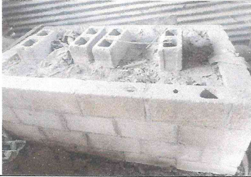
Foto 7: Con urgencia se necesita cambiar la estufa rural ya que en el mes de abril se empieza a dar alimentos a los estudiantes y es prioridad tener un espacio adecuado para cocinar.