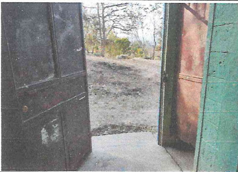
Foto 3: Las puertas de los baños y salones de clase están muy deterioradas, necesitan ser cambiadas.