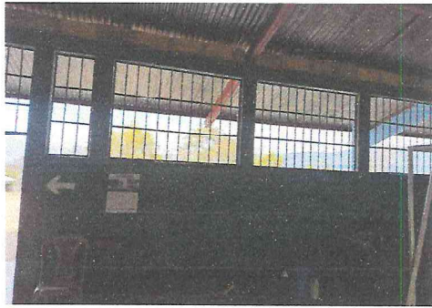
Foto 1: Se necesita sellar con ventanas de metal un salón que actualmente sirve como dirección y convertirlo así sala de computación y bodega.