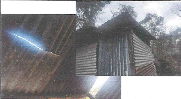
Foto 9: Parte del techo de la cocina está dañado y el corredor se ha caído.