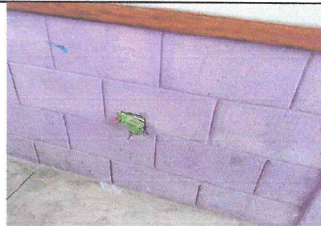
Foto 12: La mayoría de elementos del sistema eléctrico necesita ser renovado (cableado, tomacorrientes, contador)

Observación: Si es necesario se pueden agregar hojas adicionales y actualizar el número de hojas.